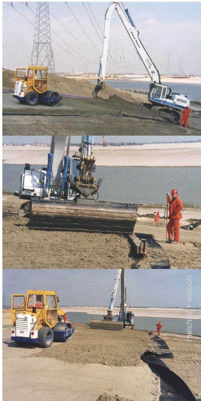
Abbildung 4 „Klassischer“ Einbau mit Langarmbagger und Walze

Das erste Projekt, in dem Trisoplast in Deutschland in eine endgültige Deponieoberflächenabdichtung eingebaut wurde, war bereits vor der Verabschiedung der Empfehlung des AK Trisoplast geplant, ausgeschrieben und vergeben worden. Die Empfehlungen des Arbeitskreises beispielsweise hinsichtlich der Schichtmächtigkeit konnten daher in dieses Projekt bauvertraglich nicht einfließen. Die vertraglich vereinbarte Mindestschichtdicke betrug 8 cm