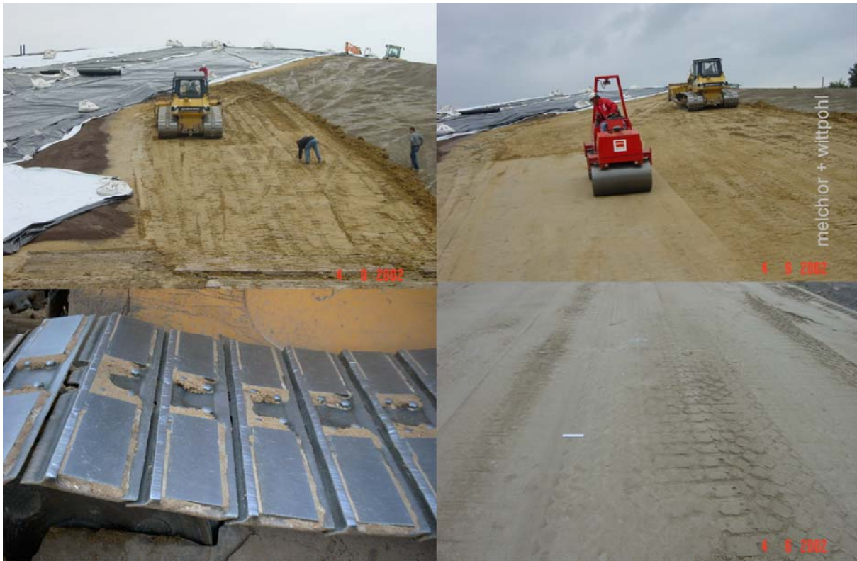
Abbildung 6 Mischgutverteilung und -verdichtung mit der Raupe

Problematisch war dabei zunächst das Eindringen der Stege der Raupenketten in das Material. Die dabei entstehende Struktur im relativ trocken eingestellten Trisoplast konnte auch mit schweren Walzen nicht mehr hinreichend geglättet werden. Die Baufirma hat daraufhin die Ketten verändert (Abtrennen der Stege und Einbau von zusätzlichen Platten zwischen den Stegen) und den Wassergehalt des Mischguts erhöht, so dass eine hinreichend glatte Oberfläche hergestellt werden konnte. Die Oberfläche wurde dann lediglich mit einer leichten Tandemwalze (2,7 t) nachbearbeitet.