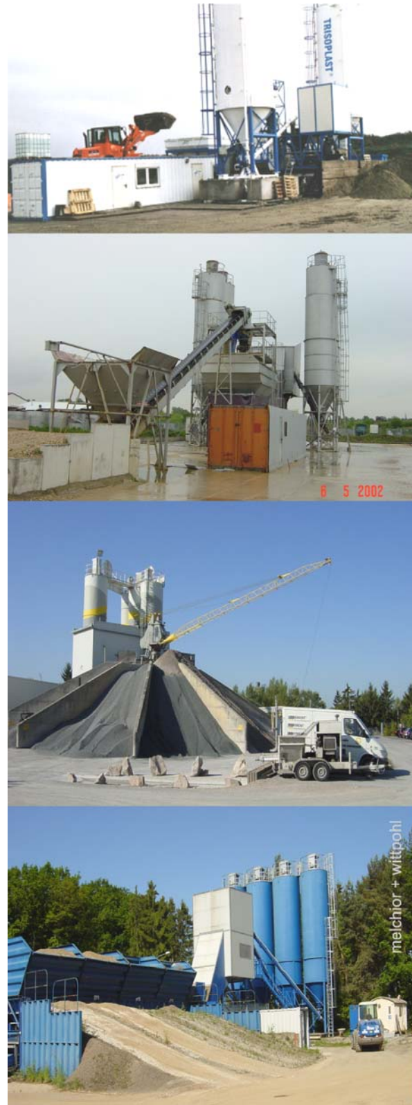
Abbildung 3 Mischanlagen

Dieser Teil des Trisoplast-Mischprozesses ist fehleranfällig und erfordert erfahrungsgemäß eine intensive und erfahrene Qualitätssicherung. Mindestens so wichtig wie die labortechnische Prüfung des produzier-