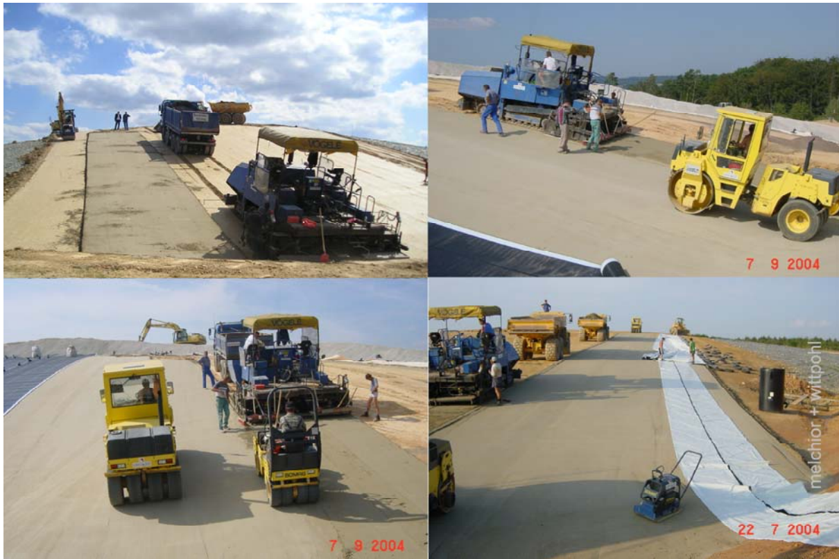
Abbildung 7 Mischgutverteilung und -verdichtung mit Fertiger und Walze

nachjustiert. Zusätzlich wird die Schütthöhe manuell überwacht. Gleiches gilt für die gleichmäßige Verteilung des Mischguts.