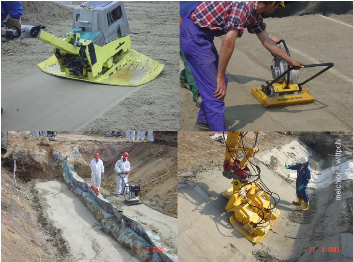
Abbildung 5 Verdichtung mit der Rüttelplatte

(in setzungsempfindlichen Randbereichen 13 cm). Eine weitere Besonderheit dieses Projekts war die Anordnung einer Sandschicht zwischen Kunststoffdichtungsbahn und Trisoplast-Dichtung. Auch die Qualitätsüberwachung war im Detail anders organisiert als die Empfehlungen des Arbeitskreises es vorsehen. Wir wurden durch den Bauherrn über den deutschen Lizenznehmer Trisoplast mit der Qualitätsüberwachung der Trisoplast-Dichtung beauftragt. Trotz dieser Besonderheiten wurden die Empfehlungen des Arbeitskreises während der Baumaßnahme beachtet und auch vor deren Hintergrund innovative Bauweisen erprobt und eingesetzt.